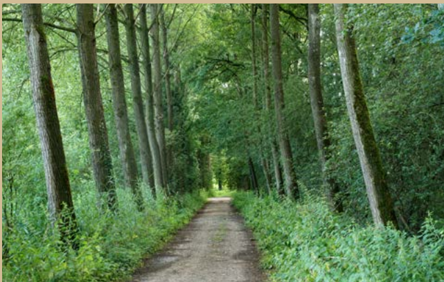
Een zandweg bij Het Hoefje in Olland

Om het Natuurnetwerk Brabant te realiseren, verwerft ARK Rewilding Nederland gronden in Het Groene Woud. Dat doen we in het kader van het natuurrealisatieproject Brabants Goud in Het Groene Woud. Per 1 december 2023 beschikten we over ruim 403 hectare grond. De ARK-methode: we verwerven gronden, zorgen voor de natuurinrichting en het tijdelijk beheer ervan. Ons meest recente Brabants Goud-perceel ligt aan het Bakkerspad (Nijnsel).