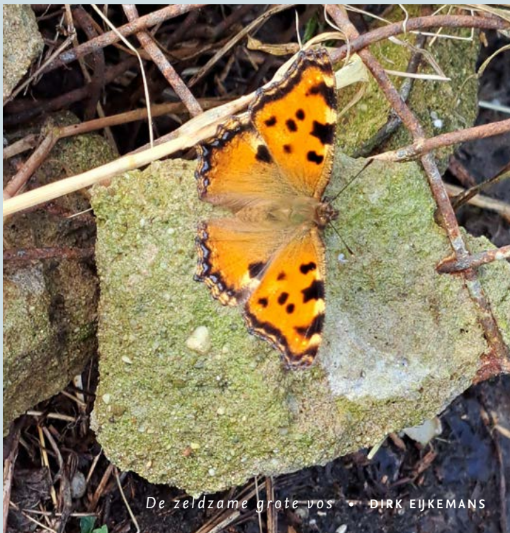
De zeldzame grote vos - DIRK EJKEMANS

Op deze kaart uit ca. 1900 van het ARK-perceel Hooge Beek (tussen de rode lijnen, met heel veel kleine perceeltjes) is vanaf het hoekje de waterloop gegraven. De verzameling gronden is na ruim 100 jaar niet meer; nu is het één groot perceel van 11 hectare.)