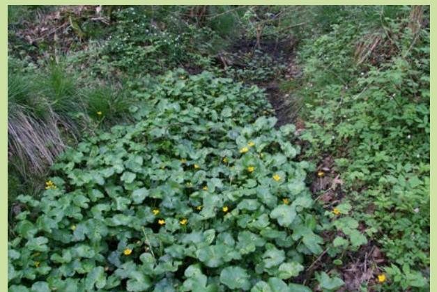
In de omgeving van Neep Hool groeit de zeldzame dotterbloem

en dotterbloem. Deze zijn een aanwijzing dat er lokaal diepe kwel (mineraalrijk grondwater) voorkomt. Hoe meer kwel, hoe groter de kans dat de natuurwaarden zich hier herstellen. Met hydrologische maatregelen helpen we dat herstel een handje. We creëren er bovendien kansen mee voor bosontwikkeling tot aan de Dommel. Daarmee dienen we nóg een doel waar we ons sterk voor maken: het verbinden van leembossen in het Dommeldal. Een bos in Neep Hool kan dan uitstekend fungeren als onmisbaar 'verbindingsbos'.