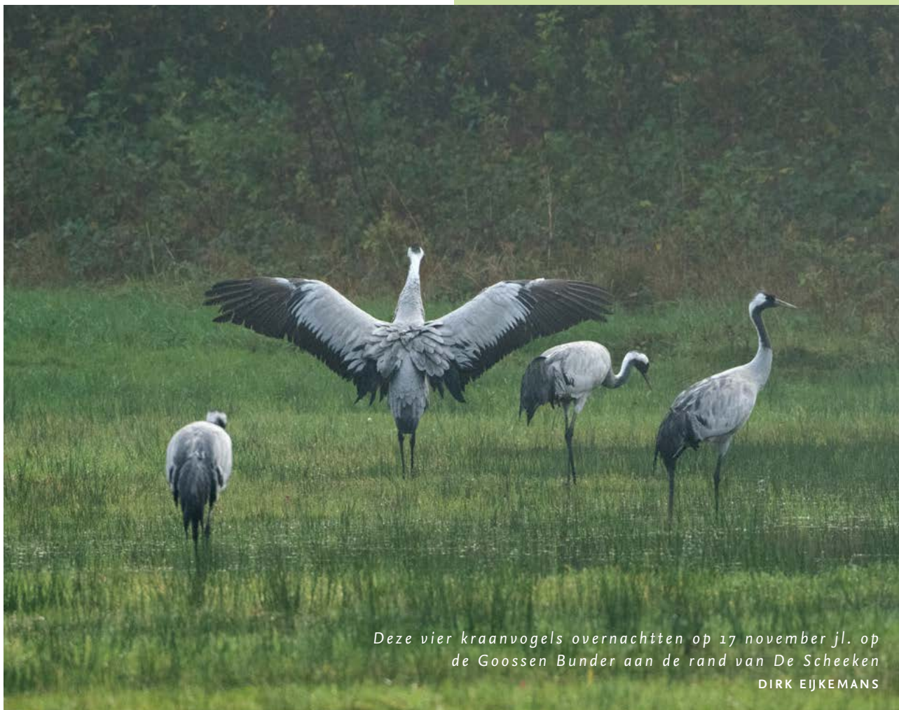
Deze vier kraanvogels overnachtten op 17 november jl. op de Goossen Bunder aan de rand van De Scheeken DIRK EIJKEMANS