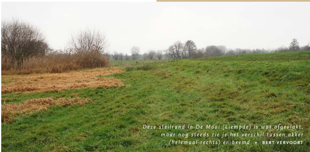
Deze steilrand in De Maai (Liempde) is wat afgevlakt, maar nog steeds zie je het verschil tussen akker (helemaal rechts) en beemd