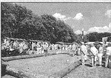
Tijdens de Week van het Landschap worden een Groene Woud Landschapsmarkt en een streekproductenmarkt gehouden.

De provincie steekt miljoenen in vier grote projecten in Het