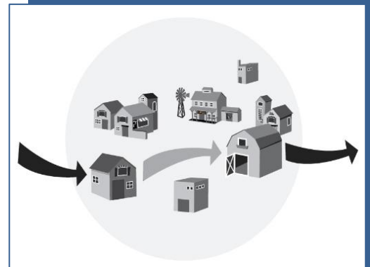
Fig. 1a: Zoals het nu gaat: geld komt de gemeenschap binnen en verdwijnt te snel naar buiten waardoor werk en bedrijvigheid te weinig kansen krijgen.

Nieuwe technologie is lastig te begrijpen. Begin jaren '90 hadden maar weinig mensen door wat het internet zou gaan betekenen voor de wereld. De betaalsystemen van banken zijn in hun logica de afgelopen 100 jaar niet wezenlijk efficiënter geworden – men heeft altijd voortgebouwd op de logica die voortkwam uit geld dat in wezen niet traceerbaar is. Maar geld