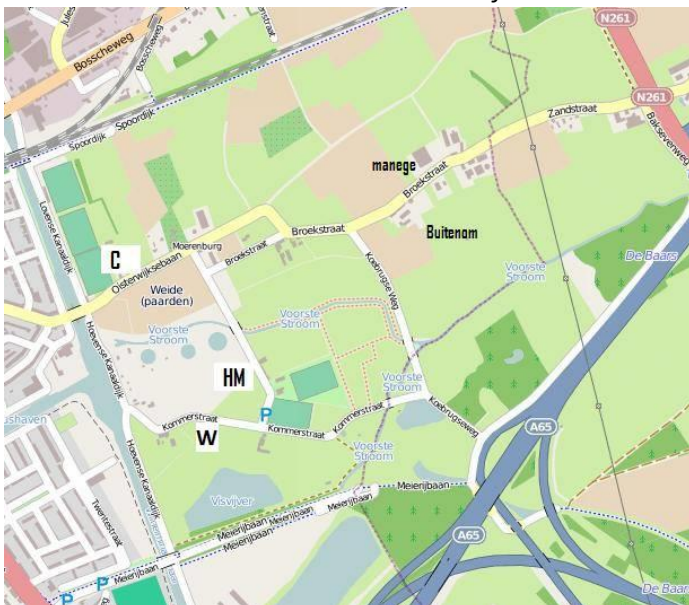
C = café Zomerlust, W = Waterpaviljoen, entree, HM = Huize Moerenburg