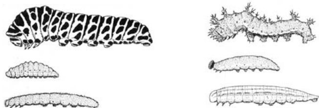
Voorbeelden van rupsen